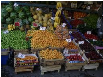
NEL NEGOZIO DI FRUTTA E VERDURA