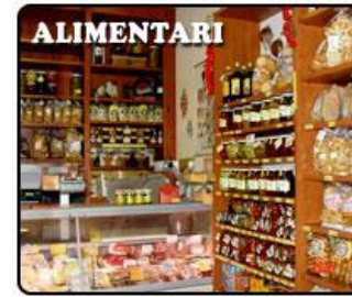
NEL NEGOZIO DI ALIMENTARI

Lenticchie Salsa Maionese Yogurt Succo di frutta Uova Latte